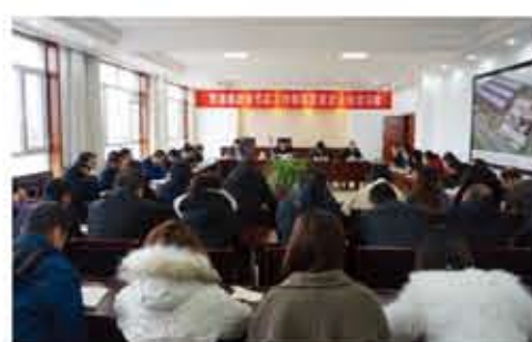
权分离”改革中，转变经营模式，加强纪律作风建设，强化执行能力，落实目标责任制，扎实推进“三权分离”，为2020年全面实施“三权分离”经营模式奠定坚实的基础。

国内经济形势都面临着一个大的变局，民营企业如何把握大势、把握机遇，如何防范金融风险，寻找新的经济增长点，如何才能在新形势下寻找“稳中求进”的发展道路。 最后，董事长就2019年度工作思路及总的指导思想进行了强调。2019年是集团公司落实“三权分离”经营模式的最后一年，是关键年、决胜年，各分公司负责人要在思想上做好充分准备，行动上提前进入状态，全身心投入到“三