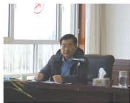
2019年2月18日，集团公司在华源农业生态园会议室召开了2019年度工作部署会议。集团公司领导班子成员、各分公司管理人员等80多人参加了会议。

集团公司2019年度工作重点，希望全体员工坚定信心、目标明确，以奋发向上的精神、百折不挠的意志、尽心尽责的态度，全力以赴，大干当前，争先创优，奋力开创新局面，不断创造华源新辉煌。紧接着，吕主任给大家解读了中国著名经济学家、清华大学经济管理学院教授魏杰的演讲。这篇文章结合中国现阶段发展情况，紧紧围绕当前中国的经济形势进行了深入的剖析和精彩的论证，尤其是在当前世界经济形势和