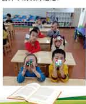
魔方可锻炼孩子手指的灵活性，在手和大脑协调配合的过程中实现对智力开发。其次，魔方可以培养孩子的记忆力，在魔方还原的过程中，孩子需要记忆一系列的还原公式，还原的次数多了，孩子的线性记忆力便会肌肉记忆。