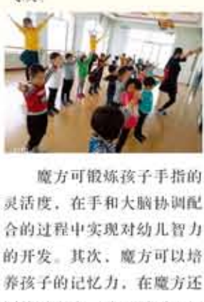
形体课可以让小朋友的身姿更挺拔，提升孩子们的气质。