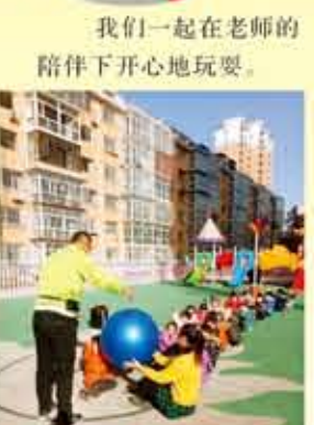
我们一起在老师的陪伴下开心地玩耍。